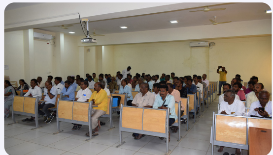
ಕೈಮಗ್ಗ ಮತ್ತು ಜವಳಿ ಇಲಾಖೆ ಪ್ರೋತ್ಸಾಹಿತ ಉತ್ಪಾದಕರ ಸಂಸ್ಥೆಗಳ ಪದಾಧಿಕಾರಿಗಳಿಗೆ ಹಮ್ಮಿಕೊಂಡ ತರಬೇತಿಯ ಚಿತ್ರಣಗಳು