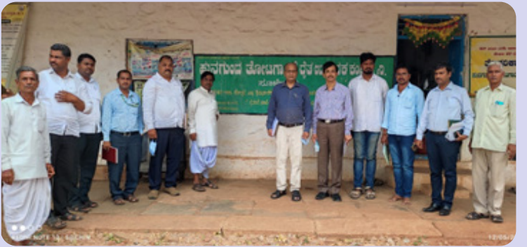
ಕಾರ್ಯ ಚಟುವಟಿಕೆಗಳ ಚಿತ್ರಣಗಳು