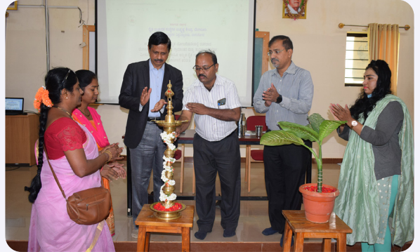
ರೇಷ್ಮೆ, ಮೀನುಗಾರಿಕೆ ಮತ್ತು ಪಶುಪಾಲನಾ & ಪಶುವೈದ್ಯಕೀಯ ಸೇವಾ ಇಲಾಖೆಗಳ ಪ್ರೋತ್ಸಾಹಿತ ಉತ್ಪಾದಕ ಸಂಸ್ಥೆಗಳ ಪದಾಧಿಕಾರಿಗಳಿಗೆ ಆಯೋಜಿಸಲಾದ ತರಬೇತಿಯ ಚಿತ್ರಣಗಳು