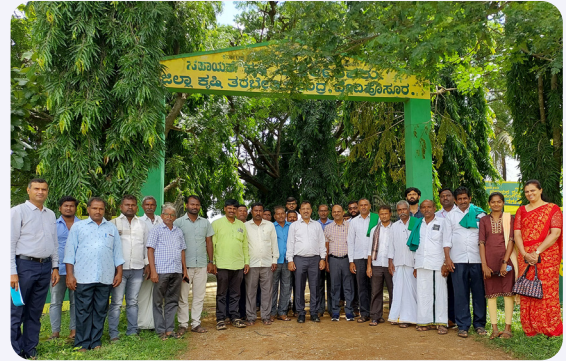
ತೋಟಗಾರಿಕೆ ಇಲಾಖೆ ಪ್ರೋತ್ಸಾಹಿತ ಉತ್ಪಾದಕರ ಸಂಸ್ಥೆಗಳ ಪದಾಧಿಕಾರಿಗಳಿಗೆ ಆಯೋಜಿಸಲಾದ ತರಬೇತಿಯ ಚಿತ್ರಣಗಳು